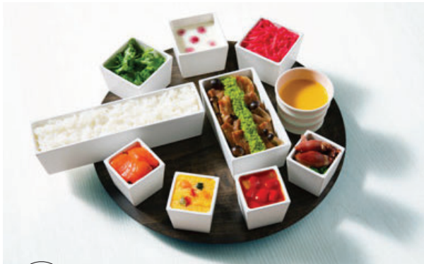
Popular Menu Seasonal Delights from Toyama "Composition" Plate ..... ¥1,980

This menu features the finest seasonal ingredients from Toyama. For details, please refer to the board or ask our staff.