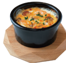
Seafood Gratin Infused with the Rich Flavors of Seafood ¥800