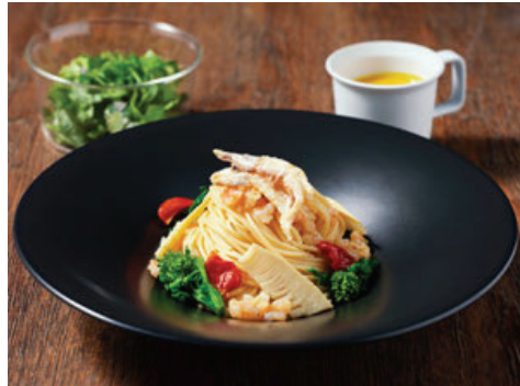
Seasonal Pasta With soup, salad ..... ¥1,750~