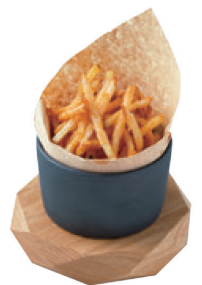
Addictive Crispy French Fries ¥550