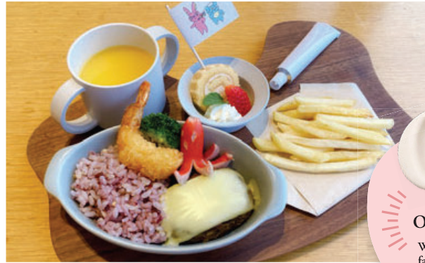
KIDS BiBiBi & JURULi Plate ..... ¥950