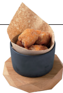
自家製塩だれの 鶏のから揚げ ¥820