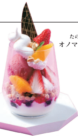
たのしき凝縮！ オノマトペサンデー ¥790