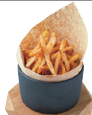
カリカリがクセになる ポテトフライ