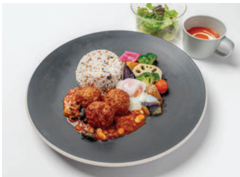
県産ポークのミートボールカレー