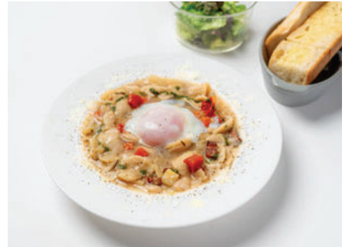
White Minestrone with Toyama Vegetables With salad, baguette, and garlic toast ..... ¥1,800