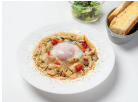
富山野菜たっぷりホホワイトミネストローネ