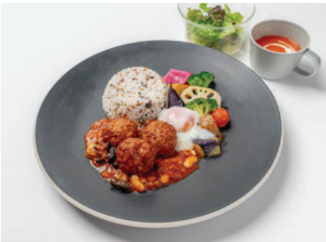
Toyama Pork Meatball Curry With soup, salad ..... ¥1,850