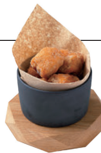
Homemade Salted Sauce Chicken Karaage (Japanese fried chicken) ¥820